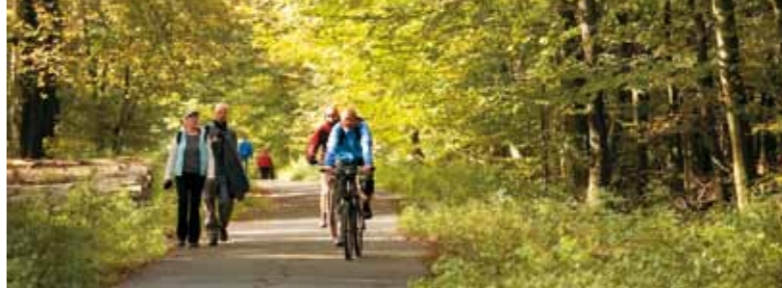
Den Deister per Rad erkunden