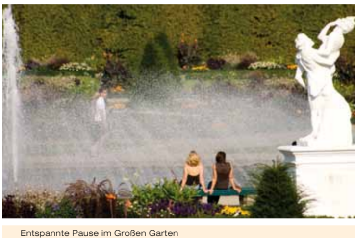
Entspannte Pause im Großen Garten