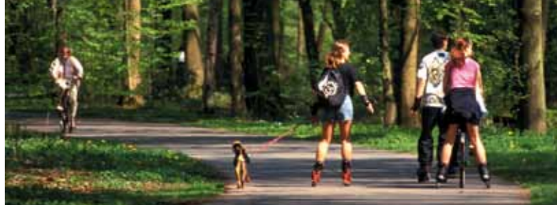
Skaten und Radfahren in der Eilenriede