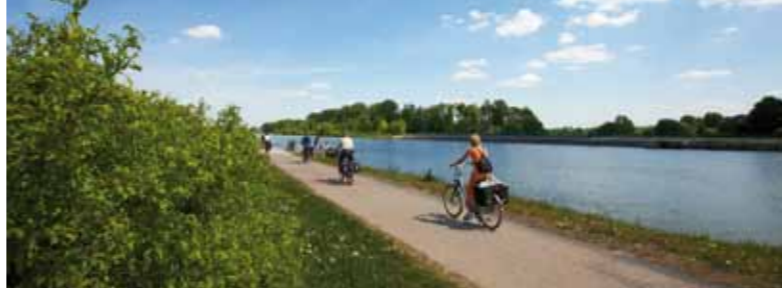
Auf Entdeckungstour entlang des Mittellandkanals