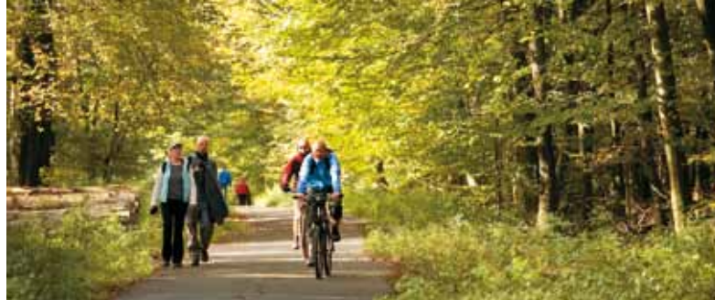
Den Deister per Rad erkunden