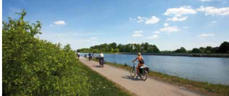
Auf Entdeckungstour entlang des Mittellandkanals