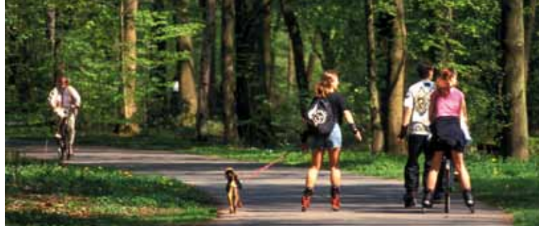
Skaten und Radfahren in der Eilenriede