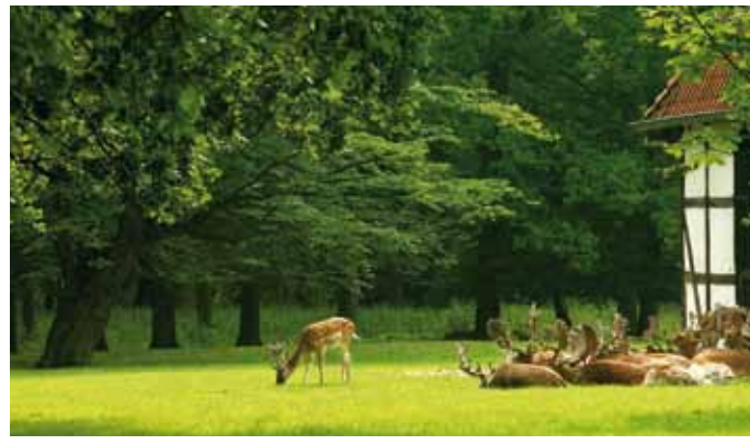
Wild im Tiergarten

Der hannoverschen Brauergilde waren die Anderter ein Dorn im Auge: Mit ihrem 1727 gegründeten Brauhaus machten sie dem Broyhan Konkurrenz. Ab 1818 bis zur Einstellung der Bierproduktion 1955 Besitz der Familie Scheele. Das Wappen am ehemaligen Verwaltungsgebäude Krümme Straße, Ecke Am Tiergarten erinnert an die Anderter Brautradition.